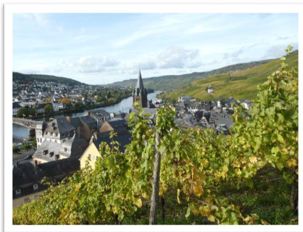
Bernkastel-Kues, Gracher Himmelreich og Wehlener Sonnenuhr. (Soluret kan skimtes i det fjerne.)

I det siste er terrenget glattet ut, eiendomsstrukturen er bedret og det er bygget nye veier slik at alle teiger kan betjenes med maskiner. Antallet aktive eiere er redusert