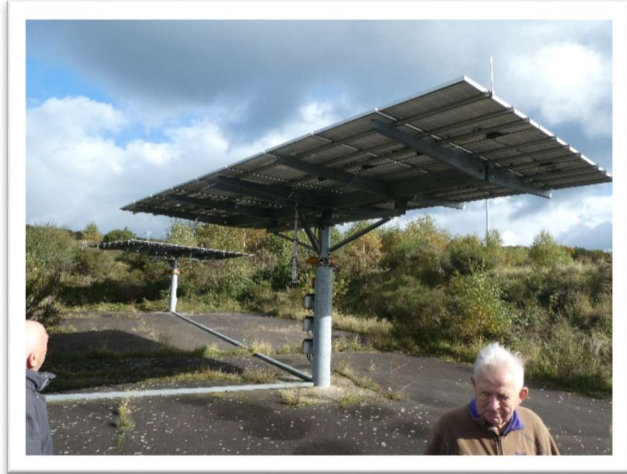
1:ideen om å dreie solceller opp mot vinden. har vist seg lite egnet. Økte driftskostnader dekkes ikke av merinntektene

liebruk hvor far og mor, datter og svigersønn søker sin inntekt, mest gjennom vindyrking og litt romutleie. Han produserer ca. 50.000 liter vi i året, hovedsakelig basert på druesorten Riesling. Produktene hans er fordelt på tørre, halvtørre og søte varianter - og ulike kvalitetsklasser ut fra druekvalitet. Men også vinbondens ferdigheter spiller en vesentlig rolle. Vinene hans er ikke å finne på Polet.