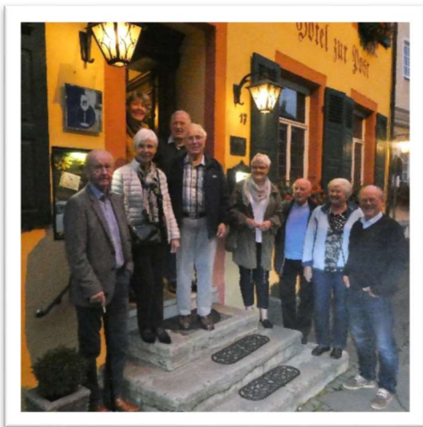
Foran Hotel Zur Post i Bernkastel-Kues.

med en tredel, og teigstørrelsen er øket til det firedobbelte. Hele området er nyplantet, og vinstokken er bundet opp i henhold til moderne forskningsresultater. Resultatet er bedret driftsøkonomi. Endringene er finansiert gjennom et spleiselag hvor EU, stat, bundeslandet og eiere har bidratt, målt ut fra hvilken nytte den enkelte bidragsyter kan hente ut.